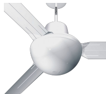
EVOLUTION LIGHT KIT ES