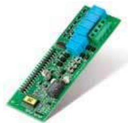
Interfaccia citofonica 1+n

Inoltre i fili vengono inseriti in un morsetto autobloccante, senza viti.